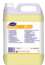
Suma Break up D3.5 5L