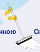
Скребок для миття